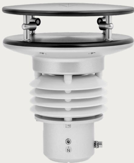
u[sonic]WS6 Für sechs Wetterparameter